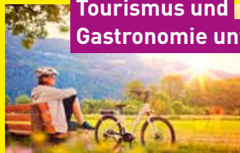
Tourismus und Gastronomie unterstützen