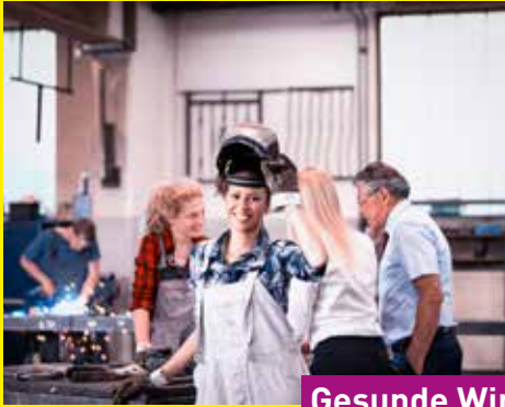
Gesunde Wirtschaft erhalten