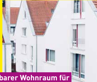
Bezahlbarer Wohnraum für alle Generationen